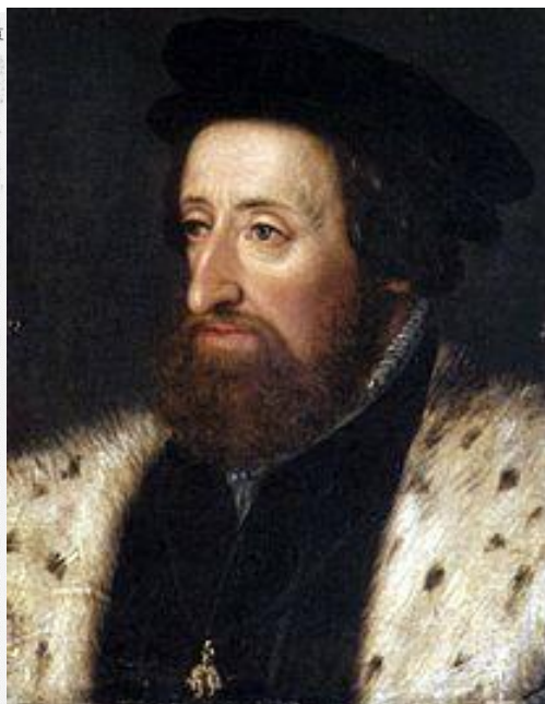
I. János (1526-1541) és I. Ferdinánd (1526-1564) magyar királyok